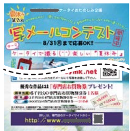
2009年夏 ケータイで撮る楽しい「夏休み」