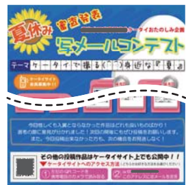
2010年夏 ケータイで撮る(^_^)身近な「夏」