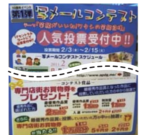
2010年冬 笑顔がいいね！我が家の笑顔自慢